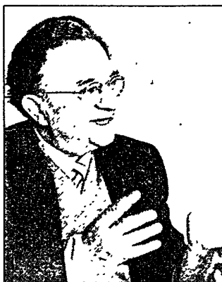
ERICH FROMM

zum Psychoanalytiker ausbilden. Nachdem er 1934 in die USA emigrieren musste, veröffentlichte er dort 1941 das Buch „Die Furcht vor der Freiheit“, das wegen seiner Analyse des Nazismus und des autoritären