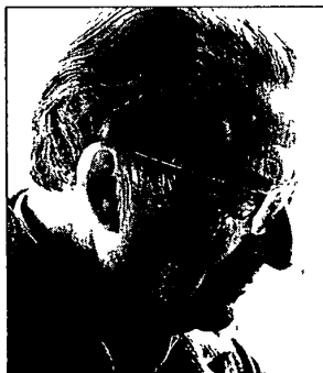
Aufrechter Humanist: Erich Fromm.

Sein Bestseller „Die Kunst des Liebens“ begleitete fast eine ganze Generation bei ihren ersten Beziehungsbeteuern. Der Psychoanalytiker, Humanist und Sozialphilosoph Erich Fromm stand in den 70er Jahren aber auch für die Ökologie- und Friedensbewegung.