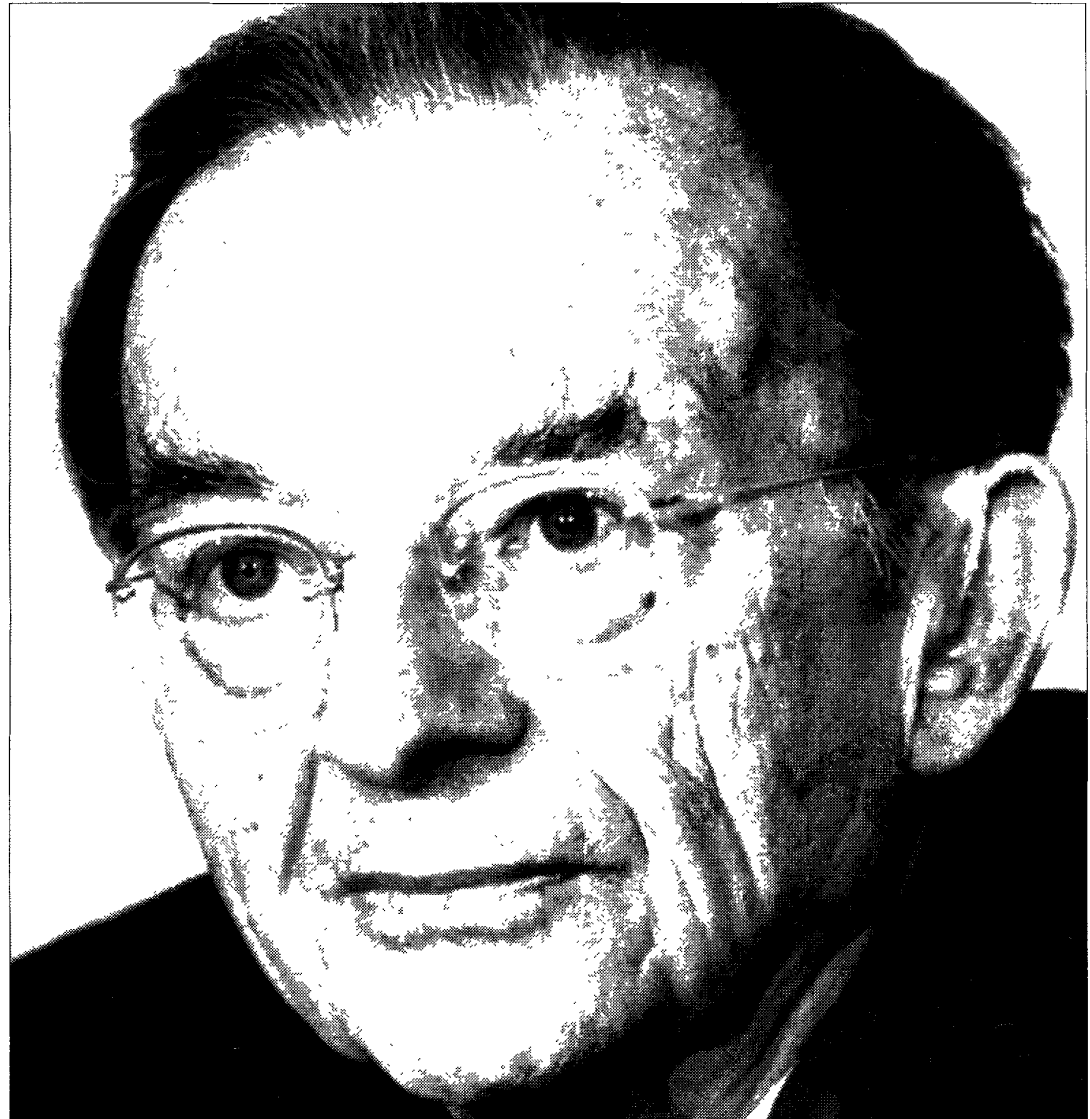
Vor 100 Jahren wurde der Psychoanalytiker Erich Fromm in Frankfurt geboren. Die Stadt würdigt ihn mit einem Festakt und einer Ausstellung im Museum Judengasse.