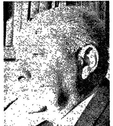
Der war's: Gottfried Benn

Alle Einsendungen an die Redaktion der AZ, 1051 Wien, Postfach 800, mit dem Vermerk „Lieblingsgedicht“.