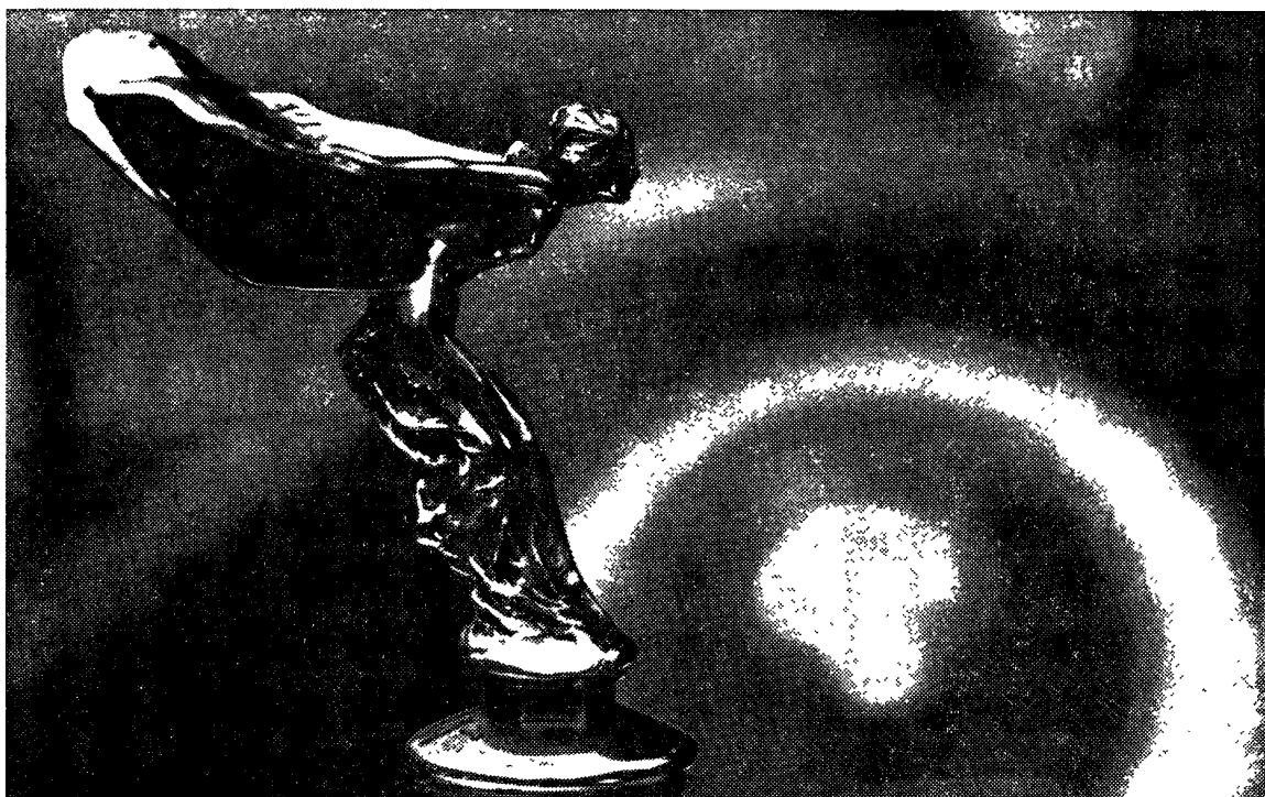
Aufbruch aus den Privilegien des Reichtums zu den Ufern einer neuen Menschlichkeit?