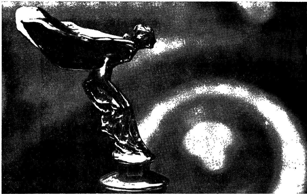
Aufbruch aus den Privilegien des Reichtums zu den Ufern einer neuen Menschlichkeit?