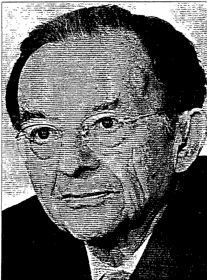
Der Psychoanalytiker Erich Fromm wäre gestern hundert Jahre alt geworden.

Als humanistischer Denker hat Erich Fromm Psychologie und Soziologie zu einer eigenständigen analytischen Sozialpsychologie verbunden, die als Erklärungsmodell für gesellschaftliche Entwicklungen nichts an Aktualität verloren hat. Am 23. März wäre er 100 Jahre alt geworden.