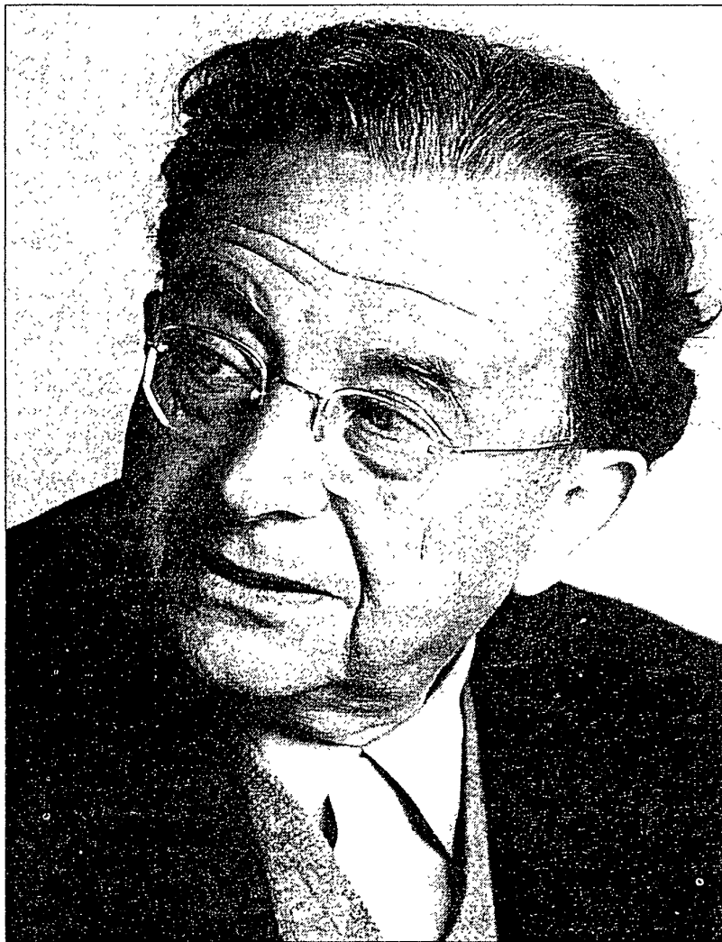
Das Leben lieben Erich Fromm (1900–1980): noch aktuell.