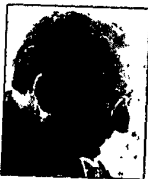
Erich Fromm schrieb die Kultbücher der 70er Jahre „Haben oder Sein“ und „Die Kunst des Liebens“

Fromm wurde am 23. März 1900 in Frankfurt am Main geboren. Einer breiten Öffentlichkeit ist er als Autor der beiden Werke „Die Kunst des Liebens“ und „Haben oder Sein“ bekannt; sein wissenschaftliches Werk ist soeben in einer 12-bändigen Gesamtausgabe erschienen. In einer jüdische Familie aufgewachsen studierte Fromm in Heidelberg Soziologie und