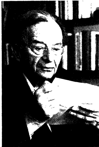
Sein Leben und sein Werk sind gleichermaßen von einem humanistischen Menschenbild geprägt: Erich Fromm

die Dinge in einem weiten Rahmen zu sehen.