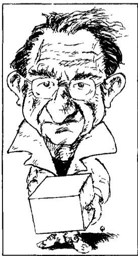
Nei ritratti di Querele, Freire, Fromm, Rogers, tre "maestri" contemporanei

«Accanto ai saperi economico e giuridico, la gente deve avere competenza pedagogica»