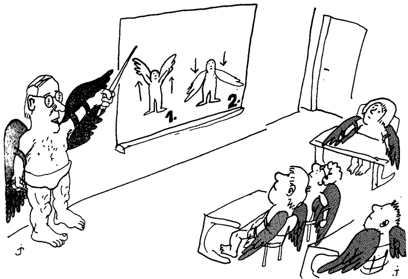
Grafik: Jan Tomaschoff (DAS)

kative Kompetenz, Handlungskompetenz) - im Sinne Vierzigs - fördern.