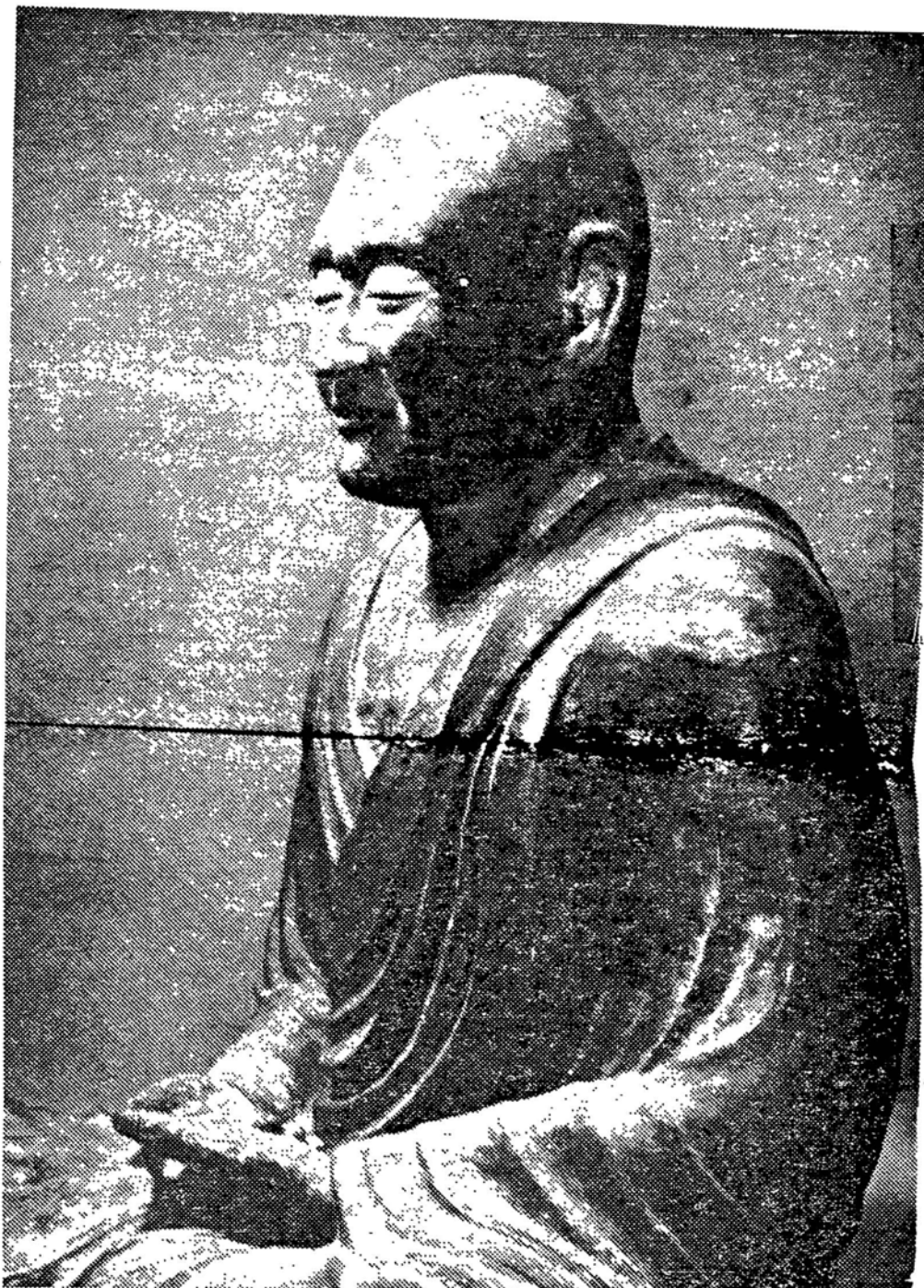
Zenmeester Priest Ganjin. Kunst uit de Nara periode

Property of the Erich Fromm Document Center. For personal use only. Citation or publication of material prohibited without express written permission of the copyright holder. Eigentum des Erich Fromm Dokumentationszentrums. Nutzung nur für persönliche Zwecke. Veröffentlichungen - auch von Teilen - bedürfen der schriftlichen Erlaubnis des Rechteinhabers.