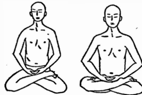
Halve en hele lotuszit

Het ik hoeft niets te doen om de lente en het gras te laten komen en Zen leert ons dat het ik evenmin hoeft in te grijpen in de gebeurtenissen en conflicten van het eigen bestaan. Met deze uitspraken begeef ik me weliswaar op gevaarlijk terrein omdat licht de indruk