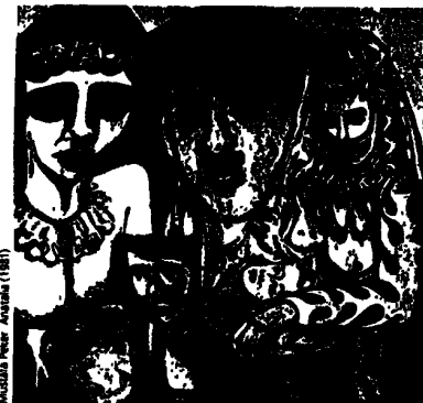
Das Fremde – der Spiegel des unentdeckten Eigenen