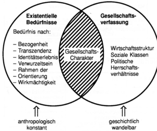
Schaubild zu den Textauszügen 1,2 und 3

= Produkt eines Zusammenspiels von existentiellen („psychischen“, „menschlichen“) Bedürfnissen und jeweiliger Gesellschaftsverfassung