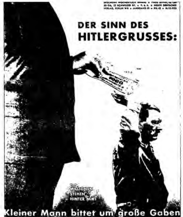
Kleiner Mann bittet um große Gaben

den Schularchiven und im Stadtarchiv reicht für eine umfassende Übersicht kaum aus, dafür sind offensichtlich zu viele Bestände durch die Zerstörung der Schule im März 1944 oder auf andere Weise verlorengegangen (5). Es bleiben aber ein paar Akten und Bilder, die Veränderungen und Entwicklungen in dieser Zeit sichtbar machen, wie sie auch an der Wöhlerschule vorsichtig sind.