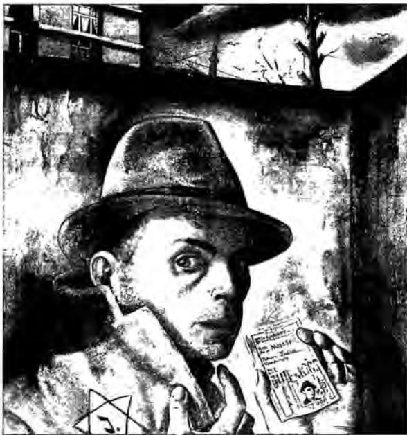
F. Nussbaum, Selbstbildnis mit Judenpaß

Als Th. W. Adorno mit dieser Frage seine Rede vor dem Koordinierungsrat für Christlich-Jüdische Zusammenarbeit im Herbst 1959 einleitet, weist er damit neben anderen auf das Verdrängen der Schuld Hitler-Deutschlands bis hin zur Zerstörung der Erinnerung in der Adenauerzeit hin. Er macht auf die verschiedensten Formen des Verdrängens aufmerksam: Auf den „Gestus des Vorallem-nichts-gewußt-Habens“, auf die Gleichgültigkeit, auf das Aufrechnen etwa der zerbombten Städte wie Dresden gegenüber Auschwitz, die mögliche Schuldhaftigkeit der Opfer, ihre Duldung Hitlers. Er und andere, wie Margarete und Alexander Mitscherlich, haben darüber hinaus diagnostiziert, inwiefern neben den in der NS-Zeit unmittelbar Schuldiggewordenen die Mehrzahl der Deutschen nach 1945 unfähig zum Erinnern und Trauern sind, ja ihre Schuld nicht begreifen. „Es kommt wohl wesentlich darauf an, in welcher Weise das Vergangene vergegenwärtigt wird; ob man beim bloßen Vorwurf stehenbleibt oder dem Entsetzen standhält durch die Kraft, selbst das Unbegreifliche noch zu begreifen.“ (1)