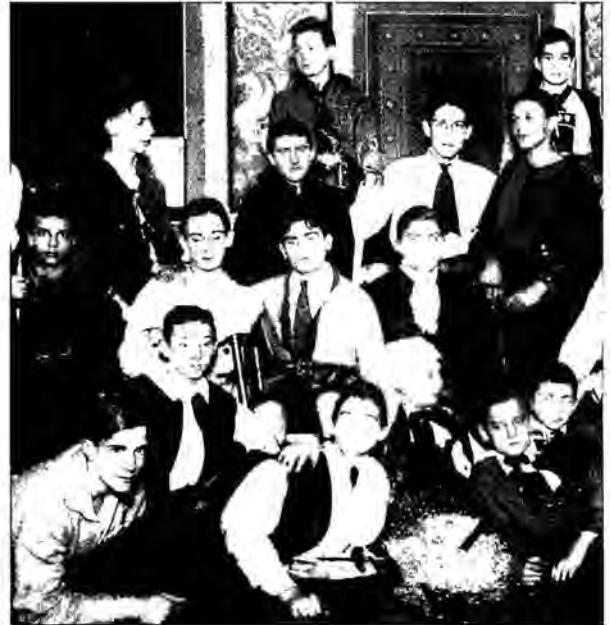
Erich Fromm (Bildmitte mit Kopftuch) bei der Aufführung von 'Wilhelm Tell' in der Aula der Wöhlerschule 1915

breitbeinig auf einem Sessel sitzend, im hellen Anzug und Krawatte, die Haare streng gescheitelt, ein Buch in den Händen haltend. Sein Blick: fragend, etwas skeptisch vielleicht; so suggeriert es zumindest jene vergilbte Schwarzweißaufnahme mit dem Titel „Der Gymnasiast“.